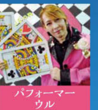
パフォーマー ウル