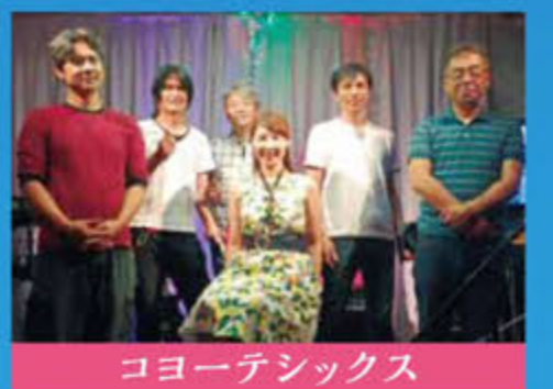
コヨーテシックス