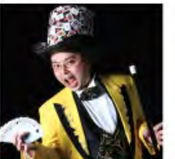
インティキマジシャン てるした