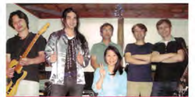
コヨーテシックス

※主催者の都合により、一部イベント内容・時間等を変更させていただく場合があります。